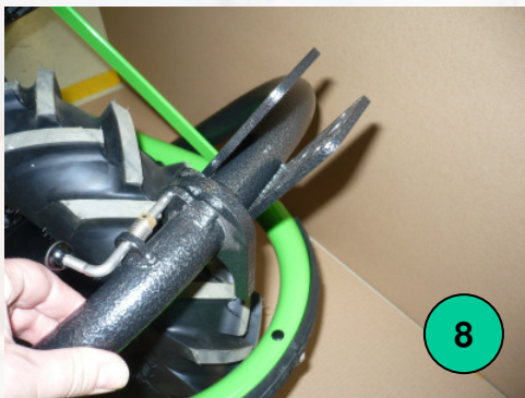
Abb. 1-14. Bleibt der UNiträger in der Grundposition, dann bitte den Kippschutz ( Bild 11 – Gummischeibe/Pos. h ) einfügen und mittels Stift ( b ), zwei Unterlagscheiben ( e ) und der Flügelmutter ( d ) fixieren.

Abb. 7-10. Fall der UNiträger nicht benutzt wird, jedoch montiert bleiben soll, ist die Verriegelung der Befestigungsschelle (Befestigung am Grundrahmen) zu lösen und der UNiträger an die Transportmulde zu kippen. Die Arretierung in dieser Position erfolgt an der Bördelkante der Transportmulde durch die Positionsteile b, c, d .